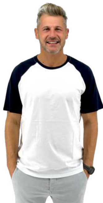
Pánské triko HB DOUBLE

HB SMOKY je pánské triko z kvalitní měkké poločesané bavlny. Žíhané/nádech kouře. Gramáž 180g/m2. 100% poločesaná bavlna.