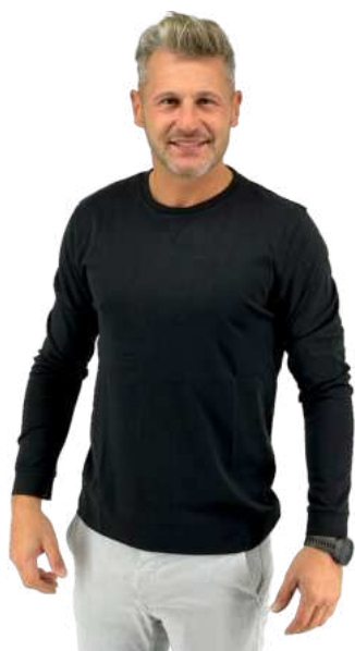
Pánské triko HB TOP SLEEVE

HB SLEEVE je pánské triko s dlouhým rukávem. Kvalitní měkká česaná bavlna. Gramáž 175g/m 2 . 100% bavlna.