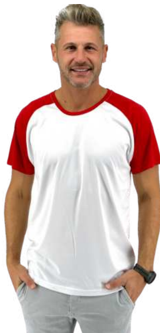
Pánské triko HB FUN DOUBLE

HB FUN je pánské triko na sportování. Odlehčený materiál. Gramáž 130g/m 2 . 100% polyester.