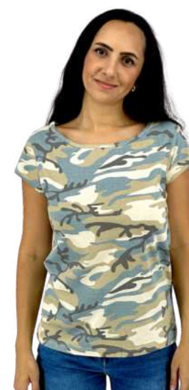
Dámské triko HB CAMO

HB DOUBLE je dámské triko z kvalitní česané bavlny. Dvoubarevná kombinace. Gramáž 175g/m2. 100% česaná bavlna.