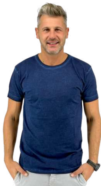
Pánské triko HB SMOKY

Nabízíme klasické i módní střihy v různobarevných provedeních.