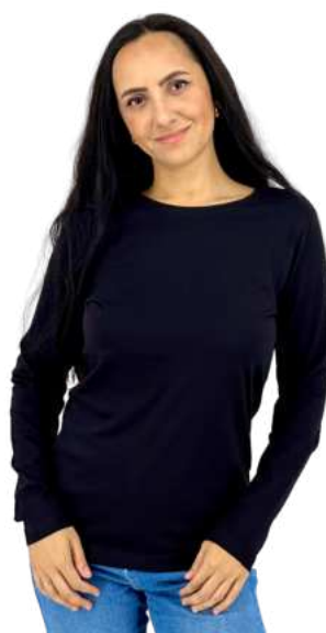
Dámské triko HB SLEEVE

HB TOP SLEEVE je pánské triko s dlouhým rukávem z top kvalitní česané bavlny. Úplety na rukávech. Křížové prošití u krku. Gramáž 190g/m 2 . 100% bavlna.