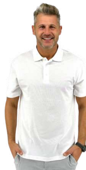
Pánské polo triko HB COOL P.

HB SLEEVE je dámské triko s dlouhým rukávem. Kvalitní měkká česaná bavlna. Gramáž 175g/m 2 . 100% bavlna.