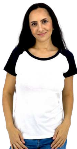
Dámské triko HB DOUBLE

HB SMOKY je dámské triko z kvalitní měkké poločesané bavlny. Žíhané/nádech kouře. Gramáž 180g/m2. 100% poločesaná bavlna.