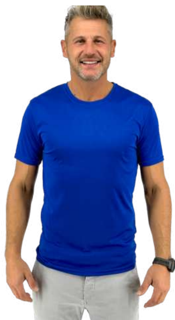
Pánské triko HB FUN

Nabízíme klasické i módní střihy v různobarevných provedeních.