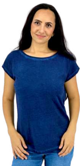
Dámské triko HB SMOKY

HB CAMO je pánské triko z kvalitní poločesané bavlny s maskáčovým vzorem. 4 barevné kombinace. Gramáž 170g/m2. 100% bavlna.