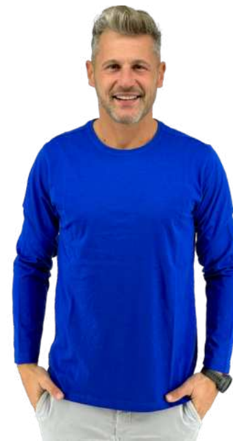
Pánské triko HB SLEEVE

HB FUN DOUBLE je pánské triko na sportování. Dvoubarevná kombinace. Gramáž 130g/m 2 . 100% polyester.