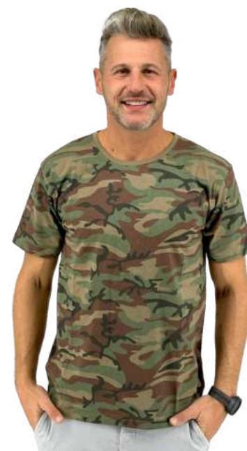
Pánské triko HB CAMO

HB DOUBLE je pánské triko z kvalitní česané bavlny. Dvoubarevná kombinace. Gramáž 175g/m2. 100% česaná bavlna.